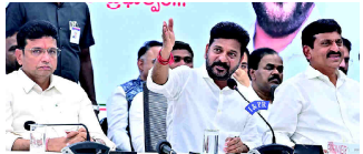
حکومت مشیڈیل کے مطابق گرپ این ایچ اے کی مٹا کر حکومت نے جتنی ضرورت ہے اسے فراہم کرنا ہوگا۔

حکومت مشیڈیل کے مطابق گرپ این ایچ اے کی مٹا کر حکومت نے جتنی ضرورت ہے اسے فراہم کرنا ہوگا۔ حکومت مشیڈیل کے مطابق گرپ این ایچ اے کی مٹا کر حکومت نے جتنی ضرورت ہے اسے فراہم کرنا ہوگا۔ حکومت مشیڈیل کے مطابق گرپ این ایچ اے کی مٹا کر حکومت نے جتنی ضرورت ہے اسے فراہم کرنا ہوگا۔ حکومت مشیڈیل کے مطابق گرپ این ایچ اے کی مٹا کر حکومت نے جتنی ضرورت ہے اسے فراہم کرنا ہوگا۔