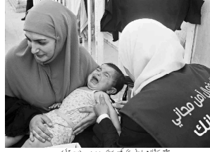
دشمن غلطی سے چھوڑ گیا، یہ وہی ہے (ایرانی)